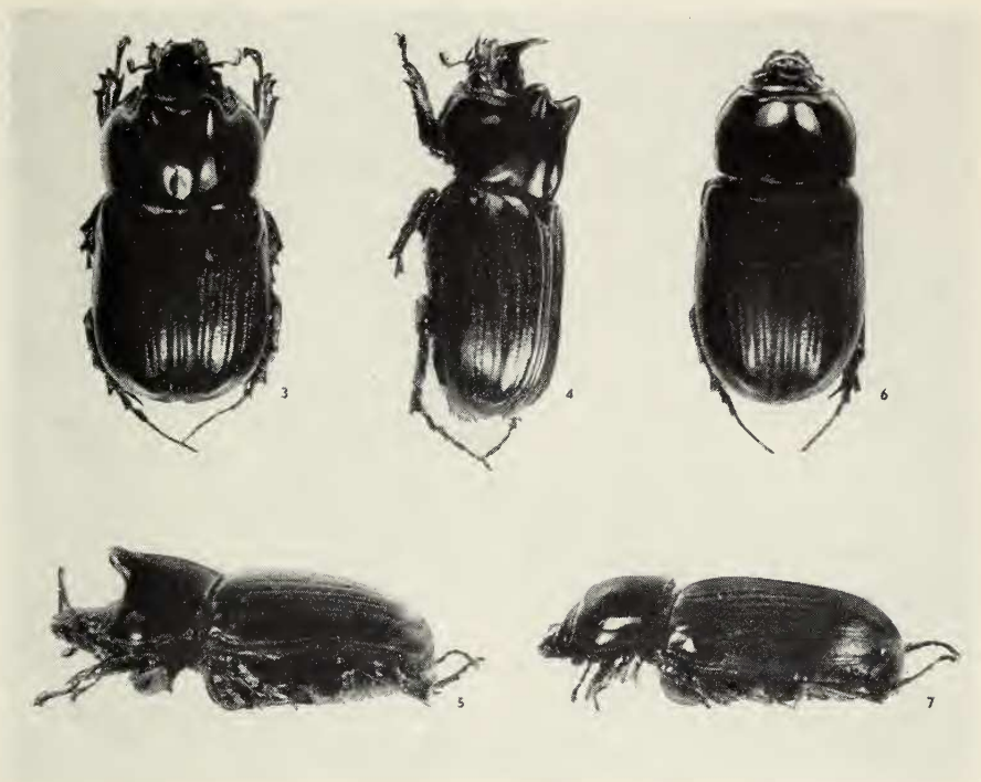
Abb. 3—5. Clysterius guineensis n. sp. Männchen, Abb. 3 Dorsalansicht, Abb. 4 Schrägansicht, Abb. 5 Seitenansicht.